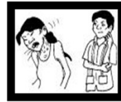
Tos por más de 15 días