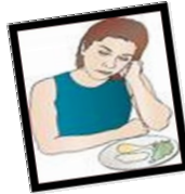
Falta de apetito