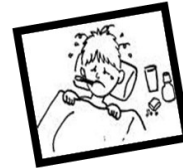
Fiebre y sudoración